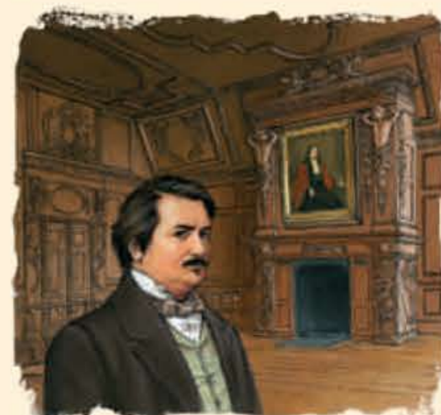
Honoré de Balzac visitant le Tribunal de Commerce

30 Le Tribunal de Commerce (XV e siècle - n°6 rue du Bercail) La tour octogonale de ce logis seigneurial permet d'accéder à la Salle d'Audience au décor Louis XIII. C'est cette pièce qui fut décrite par Honoré de Balzac dans Le Cabinet des Antiques.