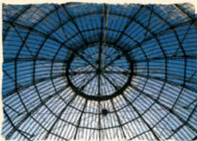
La Halle au Blé

13 La Halle au Blé (1801) Elle était vouée au commerce du grain dans cette région agricole. Entièrement circulaire et munie d'une cour intérieure, elle est faite de granit. En 1865, elle est surmontée d'une coupole de verre lui donnant un cachet tout à fait novateur. Aujourd'hui elle est dédiée aux nouvelles technologies.