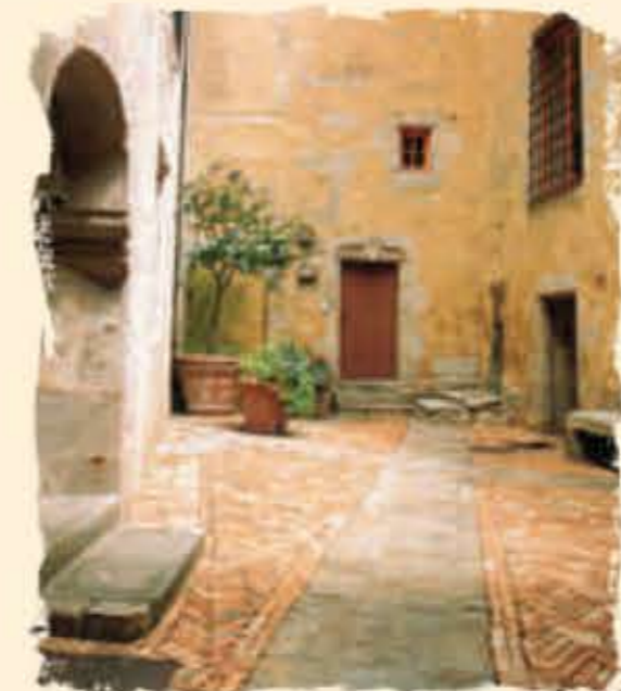
La cour Jacques-René Hébert

22 L'Hôtel-Dieu (implanté au XIV e siècle et reconstruit par la duchesse de Guise en 1679 - n°24 rue de Sarthe) Sa fonction a toujours été celle d'un hôpital. Remarquez le fronton curviligne au dessus du porche. Au XVIII e siècle, une chapelle lui a été accolée (n°26 rue de Sarthe). Au n°30 rue de Sarthe se dresse un ancien moulin du XIX e siècle au pied duquel se trouve un lavoir. Sur l'autre rive de la Sarthe s'étend le quartier Montsorié relié à Alençon par le pont de Sarthe.