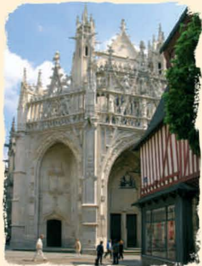
La basilique Notre-Dame

7 La rue aux Sieurs (XI e siècle) En entrant dans cette très ancienne rue commerçante, découvrez, aux angles droit et gauche, deux grands magasins caractéristiques du début du XX e siècle. Au Moyen Âge, longeant le cours de la Briante, elle est la rue de prédilection des tanneurs.