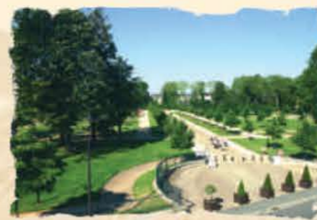
Le Parc des Promenades

23 La cour Jacques-René Hébert Né à Alençon en 1757, ce révolutionnaire, fondateur du journal Le Père Duchesne, participe en 1793 au procès de Marie-Antoinette, en tant que substitut du procureur de la Commune de Paris. Alors qu'il dénonce la modération de Robespierre, ce dernier le fait arrêter et exécuter en 1794. Au fond à droite de la cour, vous trouverez le passage couvert qui vous permet d'accéder à la cour du Dauphin et de revenir dans la Grande-Rue. Découvrez, au n°150, la Maison aux Piliers (XV e siècle) et ses arcades ogives en granit. Au n°137, une maison à pans de bois du XV e siècle abrite un passage couvert ouvrant sur la cour Cochin-de-Vaubougon. Dans celle-ci, remarquez la tourelle entièrement recouverte de bardeaux de bois.