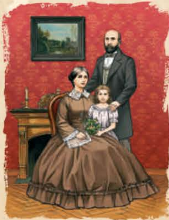
Thérèse Martin et ses parents

3 La maison de la famille Martin (n° 50 et 52 rue Saint-Blaise) La famille Martin s'y installe à partir de 1871 et c'est là que naît Thérèse le 2 janvier 1873. Louis et Zélie Martin géraient une entreprise dentellière. C'est à l'occasion de la canonisation de sainte Thérèse en 1925 qu'est construite la chapelle attenante à la maison. Laissez-vous surprendre par la mise en scène du lieu qui recrée l'ambiance et l'authenticité de la vie de sainte Thérèse et de ses parents à l'époque.