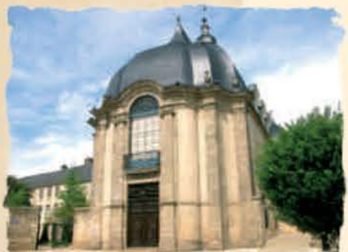
L'église des Jésuites

11 L'église des Jésuites (XVII e siècle) Elle est attenante au Collège du même nom. Les Jésuites s'y installent en 1673. Cette église de style baroque possède une toiture en forme de coque de bateau renversée. Transformée en bibliothèque en 1779, elle abrite un fond ancien des plus riches avec plus de 100 manuscrits du Moyen Âge. Nous vous invitons à pénétrer dans la bibliothèque à ses heures d'ouverture pour en découvrir les boiseries du XVIII e siècle. (Illustration au dos)