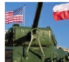
Légende : Mémorial-de-Montormel-(c)- CDT-61-(4) Credit : (c) CDT 61