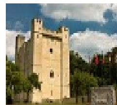
Légende : Chambois-(c)-Bischoff-Andrea-(1) Credit : (c) Bischoff Andrea