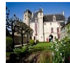
Légende : Alençon