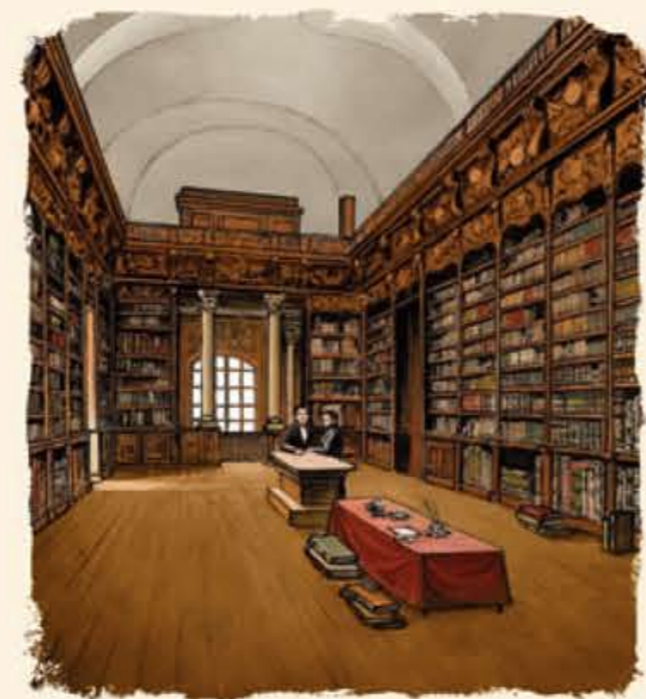
Intérieur de la bibliothèque