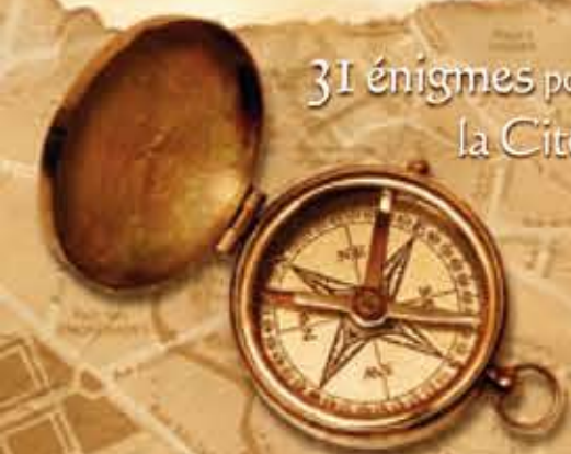
Illustration en couverture du Jeu de Piste - Reconstitution de la Porte de la Barre et de la Maison d'Ozé - Photos en couverture du Circuit découverte : La Maison d'Ozé

31 énigmes pour découvrir la Cité des Ducs