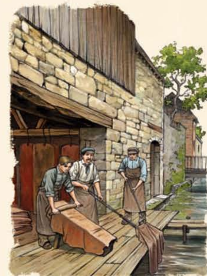
Tanneurs au travail sur la Briante