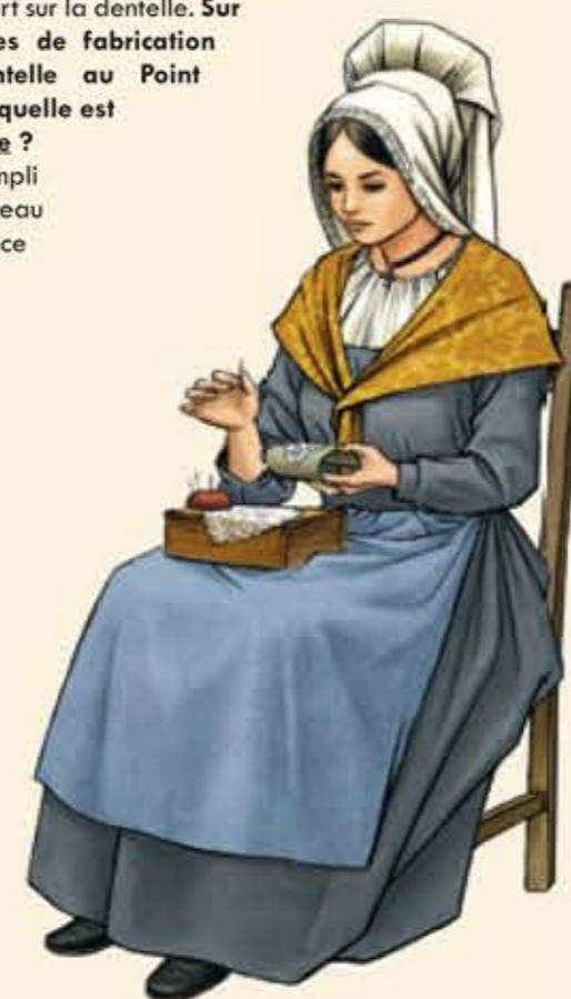
Dentellière à l'ouvrage au Point d'Alençon