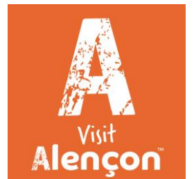
Image: Importer une image depuis votre ordinateur pour illustrer l'événement.